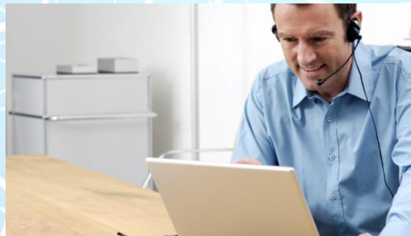
Los tutores son expertos funcionarios en cada una de las materias.

Los tutores que guiarán al alumno en el proceso de preparación y los que han preparado cada uno de los temas, son ingenieros que han superado las oposiciones de Castilla y León.